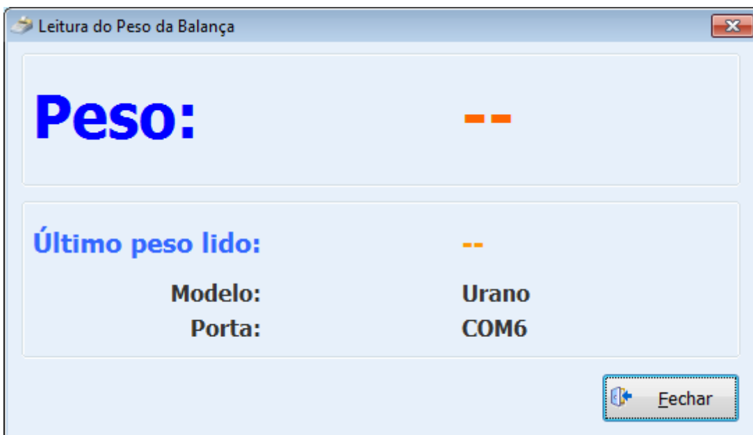
Tela para teste de balança

Ao selecionar balança no menu mostrado na imagem acima, a tela que será aberta para testes com balança será da imagem abaixo.