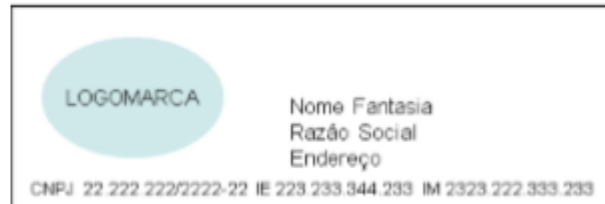
Figura 1 – Opção de cabeçalho com logomarca , em bobina contínua de papel largo (8cm): os dados de Nome Fantasia, Razão Social e endereço ficam dispostos à direita da logomarca.