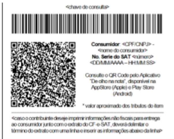
Figura 2 – Exemplo de rodapé de extrato de CF-e-SAT, em bobina contínua de papel largo (8cm), com o código de barras representando 44 caracteres.