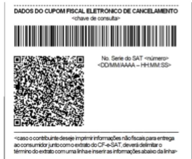
Figura 3 - Exemplo de rodapé de extrato de CF-e-SAT de cancelamento, em bobina contínua de papel largo (8cm), com o código de barras representando 44 caracteres.

No sistema, as configurações de impressão do SAT foram reajustadas: