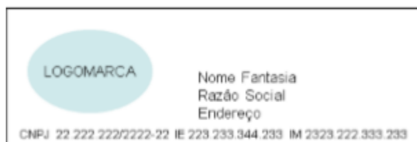
Figura 1 – Opção de cabeçalho com logomarca , em bobina contínua de papel largo (8cm): os dados de Nome Fantasia, Razão Social e endereço ficam dispostos à direita da logomarca.