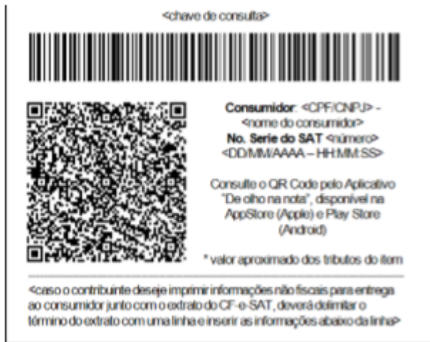
Figura 2 – Exemplo de rodapé de extrato de CF-e-SAT, em bobina contínua de papel largo (8cm), com o código de barras representando 44 caracteres.