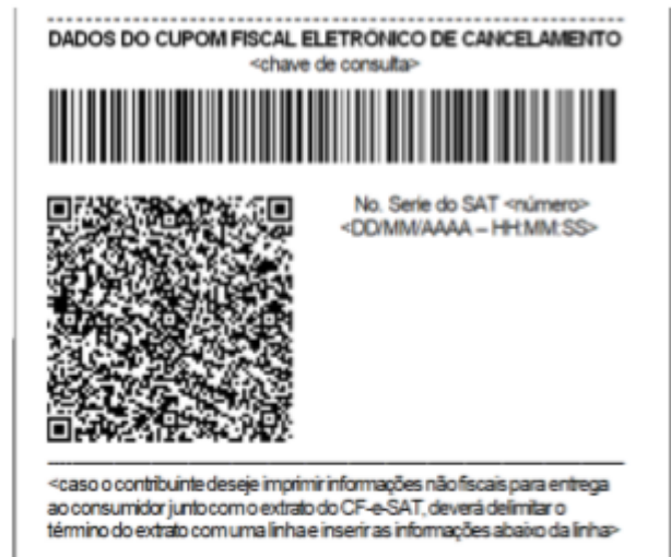
Figura 3 - Exemplo de rodapé de extrato de CF-e-SAT de cancelamento, em bobina contínua de papel largo (8cm), com o código de barras representando 44 caracteres.

No sistema, as configurações de impressão do SAT foram reajustadas: