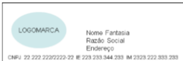
Figura 1 – Opção de cabeçalho com logomarca, em bobina contínua de papel largo (8cm): os dados de Nome Fantasia, Razão Social e endereço ficam dispostos à direita da logomarca.