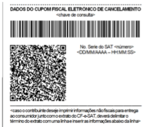
Figura 3 - Exemplo de rodapé de extrato de CF-e-SAT de cancelamento, em bobina contínua de papel largo (8cm), com o código de barras representando 44 caracteres.

No sistema, as configurações de impressão do SAT foram reajustadas: