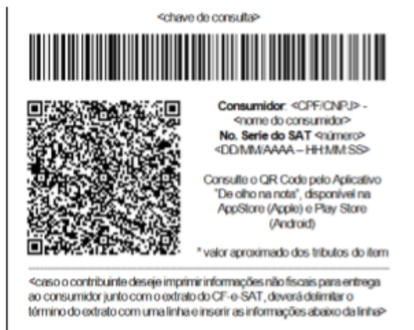
Figura 2 – Exemplo de rodapé de extrato de CF-e-SAT, em bobina contínua de papel largo (8cm), com o código de barras representando 44 caracteres.