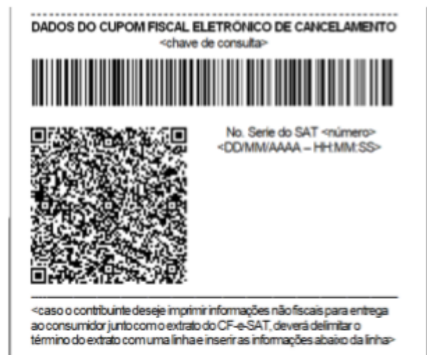
Figura 3 - Exemplo de rodapé de extrato de CF-e-SAT de cancelamento, em bobina contínua de papel largo (8cm), com o código de barras representando 44 caracteres.

No sistema, as configurações de impressão do SAT foram reajustadas: