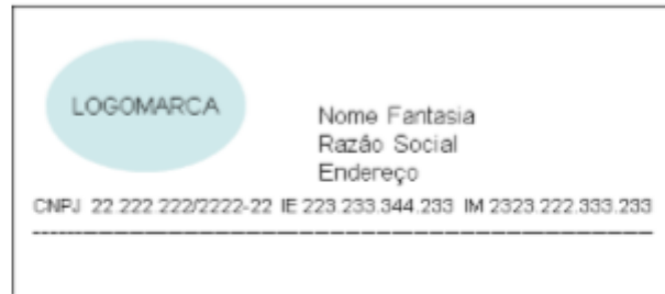
Figura atual, efeitos até 31.12.18