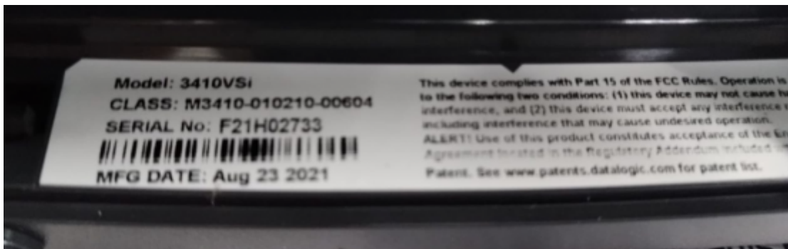
Balança de Conferência