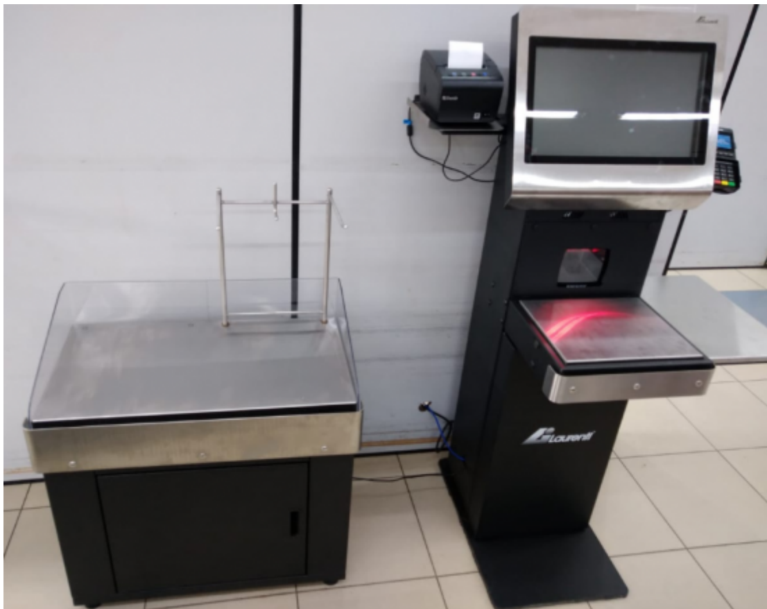
Leitor de Código de Barras