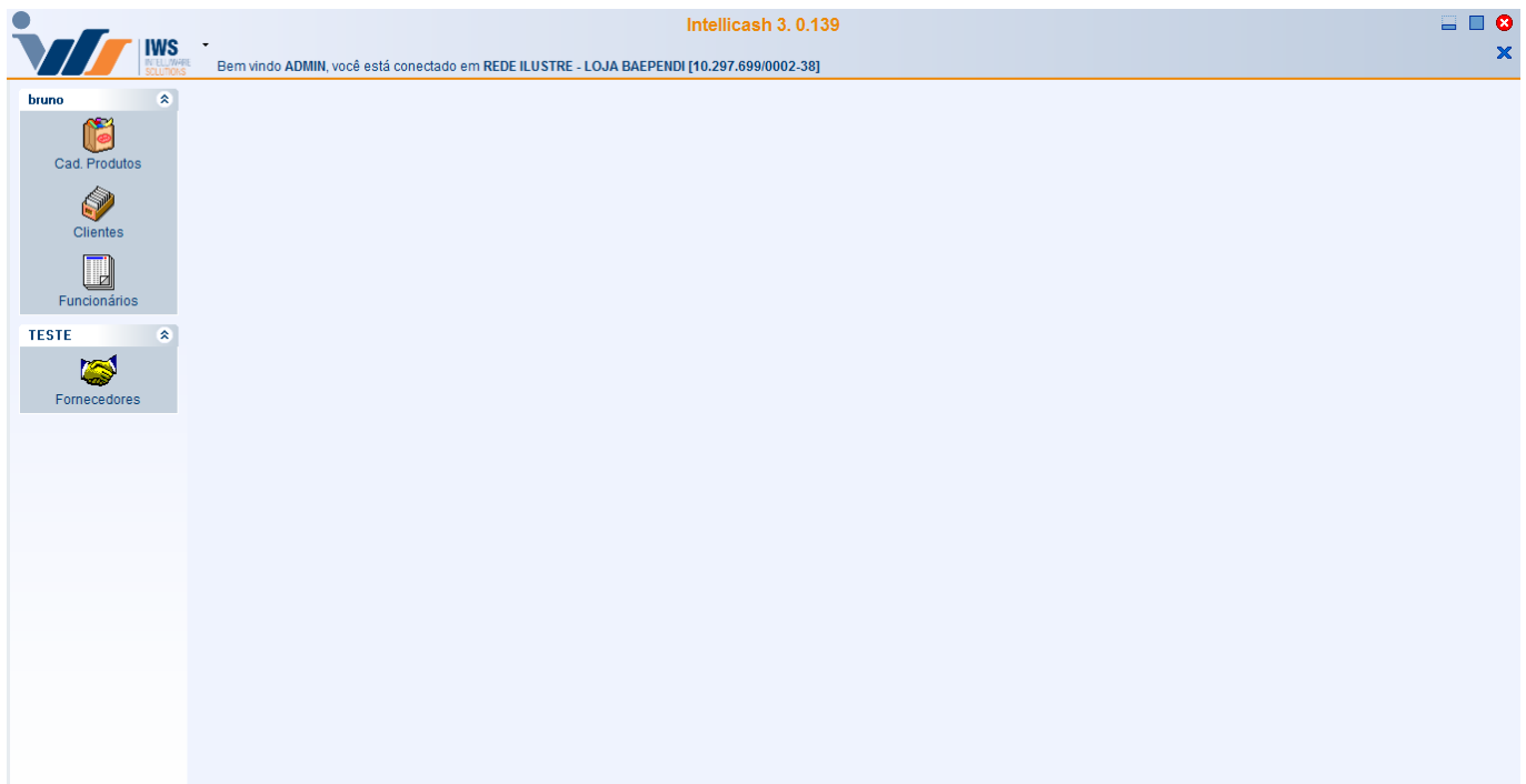
Tela Inicial do Sistema com Menu

Após clicado neste botão para “ Expandir ” o menu, verá o mesmo na tela principal.